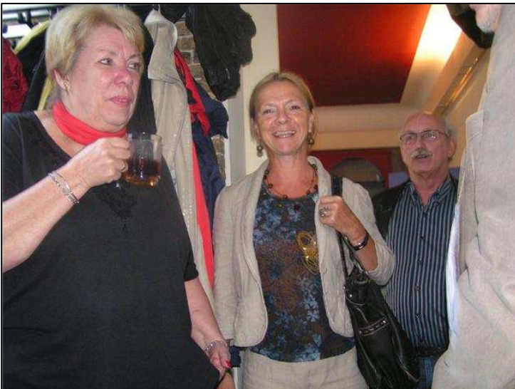
Politiek Café biedt ruimte voor zowel debat als gezelligheid